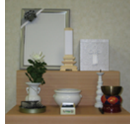
後飾り祭壇 (リース)