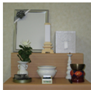
後飾り祭壇 (リース)