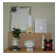
後飾り祭壇 (リース)